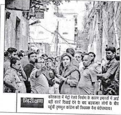
कोलकाता में मेट्रो रेलवे निर्माण के कारण स्मार्ट सिटी बंदी दरार दिखाई देने के बाद बजटभार लोगों के बीच पहुंची गुणवत्ता को संतुष्ट करने का विचारक नेना बंदीवादाय।

कोलकाता हाई कोर्ट में 72 न्यायाधीशों की स्वीकृत संख्या है और वह केवल 39 न्यायाधीशों के साथ काम कर रहा है। तीन नवनियुक्त न्यायाधीशों के साथ लंबित के बाद यह संख्या बढ़कर 42 हो जाएगी। लेकिन फिर भी स्वीकृत संख्या से 30 की या 41.66 फीसद की कमी रहेगी।